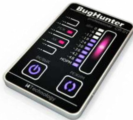
Рисунок 1. - внешний вид изделия

Внешний вид изделия представлен на рисунке 1.